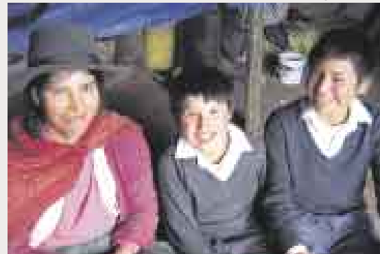
Formar familia. Según Yamamoto, una familia plena es clave.